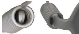
Avec assemblage solide