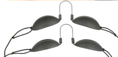
Durette II régulier et petit. Traité à l'intérieur pour diffuser la lumière